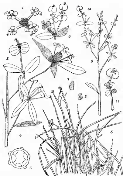
Fig. 1. — Euphorbia orthoclada : 1, ombelle de la sous-espèce orthoclada avant le développement des cyathophylles, gr. nat.; 2, do, cyathophylles développées \times 1/2 ; 3, ombelle en fruits; 4, rameau fleuri (saison des pluies) \times 2/3 ; 5, port en culture à Tananarive (octobre) \times 1/8 ; 6, grain de pollen \times 350 ; 7, une coque de fruit; 8, graine gr. nat. — Sous-espèce vepretorum : 9, rameau fleuri \times 2/3 ; 10, ombelle en fruit; 11, un cyathium en fruit \times 2 .